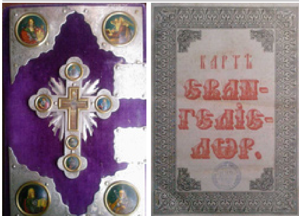
Evangelierul Biericii Ortodoxe Române din Pecica, din 1877.

început 3 preoți români și unul sârb, slujind dumnezeieștile slujbe în două duminici consecutive în limba română, iar în a treia în limba sârbă. Printre credincioșii parohiei se aflau și câțiva macedo-români, numiți “greci”, dintre care unii s-au distins a fi binefăcători ai sfintei biserici.