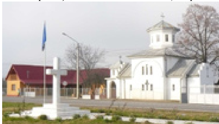
Capela, casa mortuară și crucea ridicate în 2007